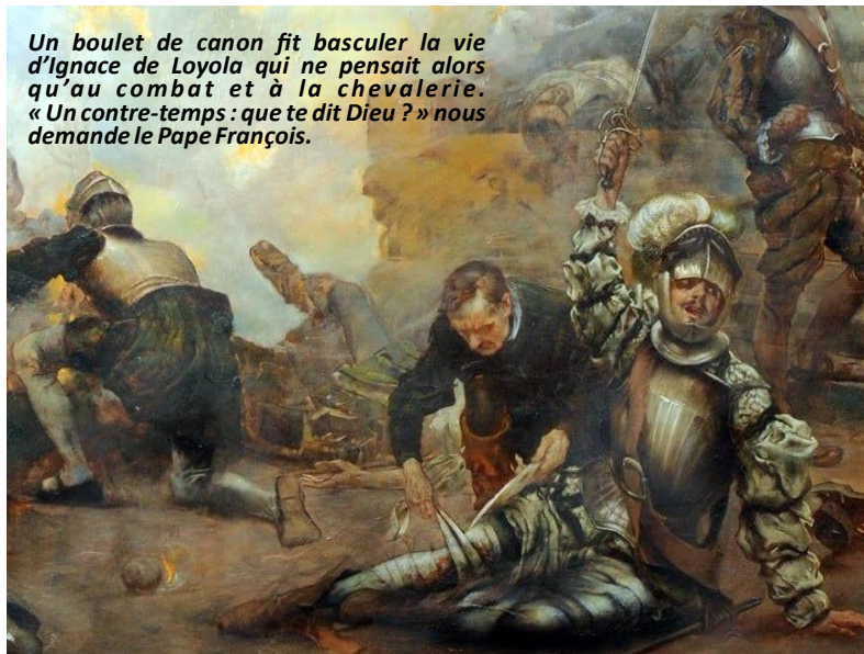
Un boulet de canon fit basculer la vie d'Ignace de Loyola qui ne pensait alors qu'au combat et à la chevalerie. « Un contre-temps : que te dit Dieu ? » nous demande le Pape François.

bonne pensée te parvient, de la joie, c'est notre propre expérience. Lui, Ignace, fait sa première expérience de Dieu, en écoutant son propre cœur, qui lui montre un curieux renversement. C'est ce que nous devons apprendre : écouter son propre cœur : pour savoir ce qui se passe, quelle décision prendre, pour porter un jugement sur une situation, il faut écouter son propre cœur. Nous écoutons la télévision, la radio, le téléphone portable, nous sommes des maîtres de l'écoute, mais je te demande : sais-tu écouter ton cœur ? T'arrêtes-tu pour dire : "Mais comment va mon cœur ? Est-il satisfait, est-il triste, cherche-t-il quelque chose ?". Pour prendre de bonnes décisions, il faut écouter son propre cœur.